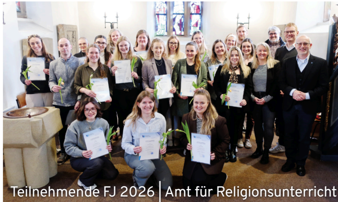
Teilnehmende FJ 2026 | Amt für Religionsunterricht

„Das Fach Religion hat seine besonderen Herausforderungen, insbesondere an die Lehrpersönlichkeit – es hat aber auch besondere Chancen.“